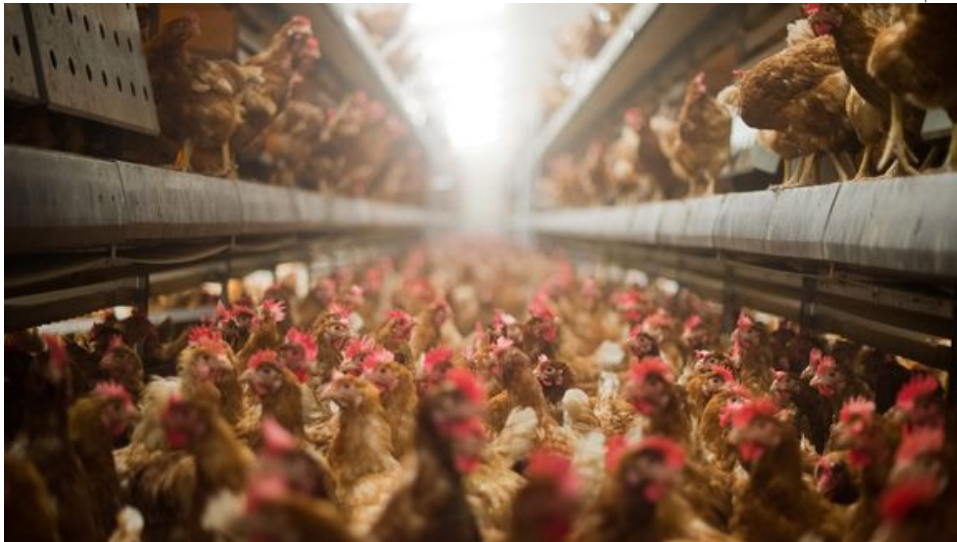
Legehennen in einem Stall in Niedersachsen

Der Teufel trägt einen grünen Overall. In der einen Hand hält er einen Kescher, in der anderen einen Plastikeimer. Bei jedem Schritt flüchten Küken vor seinen Gummistiefeln. 42.000 Tiere leben in diesem Stall in Barsinghausen in der Nähe von Hannover. Es ist heiß, und es riecht nach Ammoniak. Sobald der Mann ein schwaches Tier sieht, schnappt er es. Mit schnellem Griff dreht er dem Küken den Hals um. Später wird er ihm den Bauch aufreißen, um in Niere und Darm nach Anzeichen für Infektionen mit Keimen zu suchen.